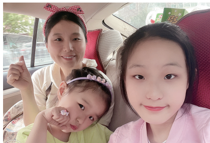
推荐人周夏和女儿合影。

推荐理由: 大女儿11岁,小女儿5岁。作为家里有俩宝贝的宝妈来说,这个口袋公园太适合遛娃了。孩子们可以找到小伙伴,负责照看孩子的家长也有休息的空间。相信这里将成为这个暑假,我带孩子最常去打卡的地方了。