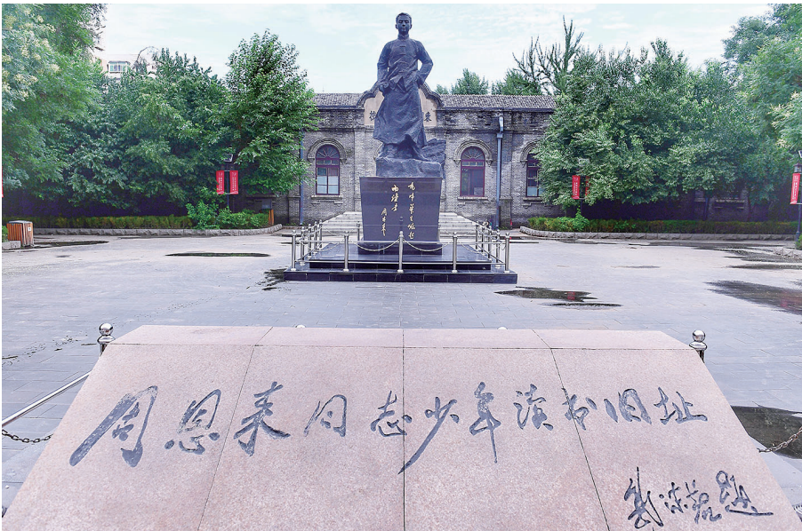
周恩来同志少年读书旧址。