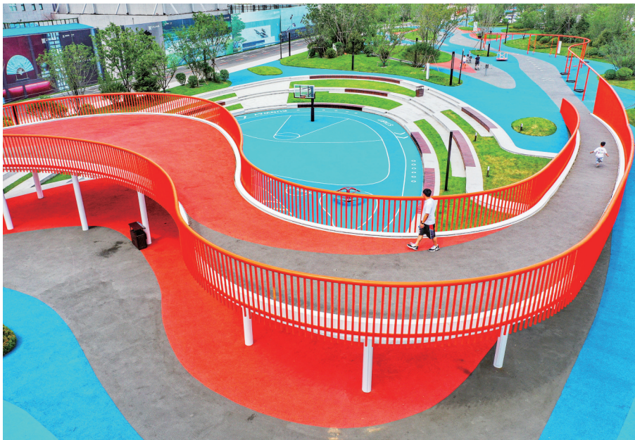
位于沈阳市皇姑区鸭绿江北街上的亲子口袋公园。