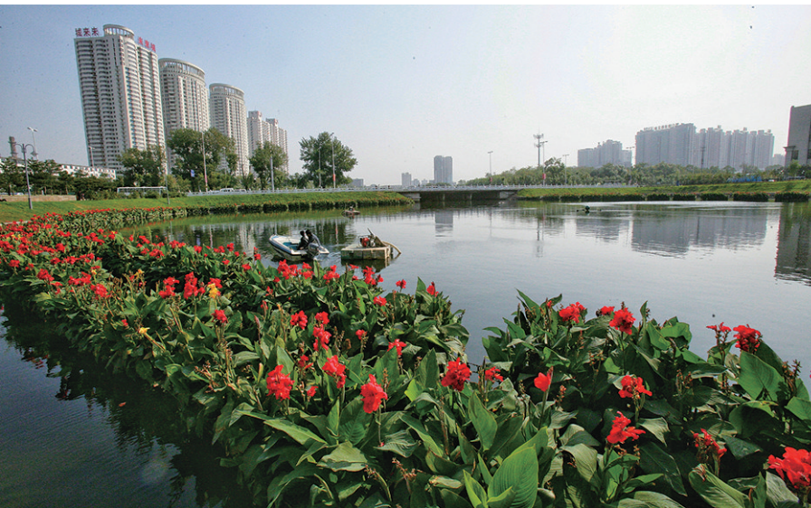
南运河作为一条城市水系，对美化城市起到了不可或缺的作用。

南运河带状公园位于沈阳市市区南部，占地面积314公顷。贯穿于带状公园的南运河，东起东塔闸门，西至龙王庙闸门，蜿蜒14.5公里。河水畅流，连同沿河各公园的湖面，河湖水面80公顷，林带葱郁，连通了大东、万泉、万柳塘、青年、鲁迅、南湖六大公园和黎明、东塔、春晓、夏芳、怡静、皂角、秋瑾、阳春等共18个游园。建成之初绿地面积234公顷，形成了清水长流、绿树成荫、景点相连、繁花似锦、道路畅