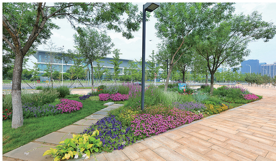
花境口袋公园，各种花草交错掩映，点缀出空间美感。