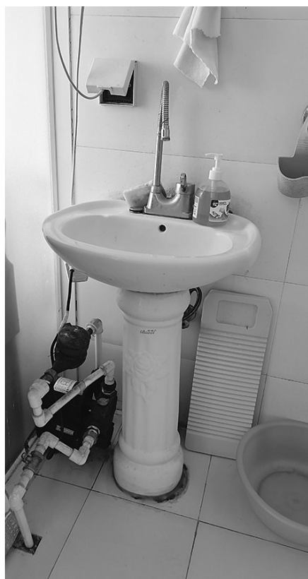
五楼的居民家即使装有自吸泵,水流也远低于正常居民家小很多。