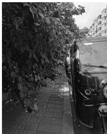
树木无人修剪影响通行。