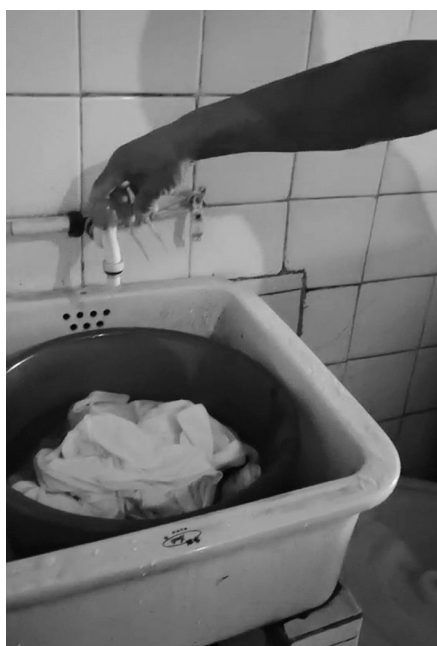
朱先生拧开水龙头,但是里面并没有自来水流出。