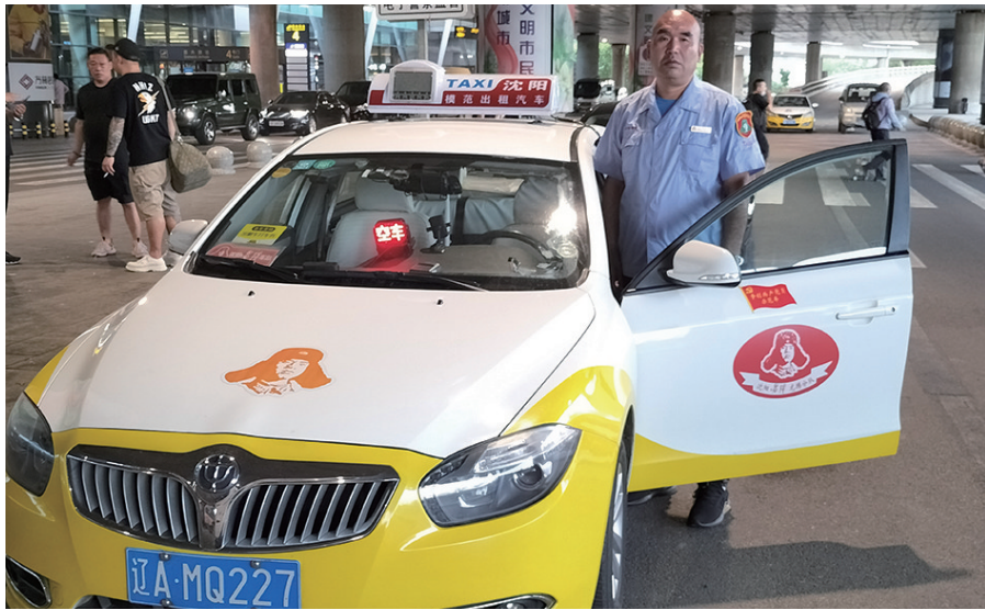
杜江坚守在桃仙机场转运旅客。