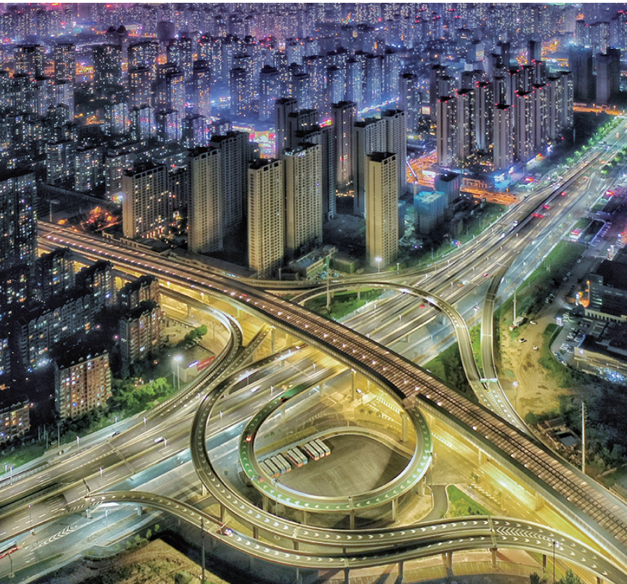
胜利大街立交桥被称作沈阳最美的“音符立交”。