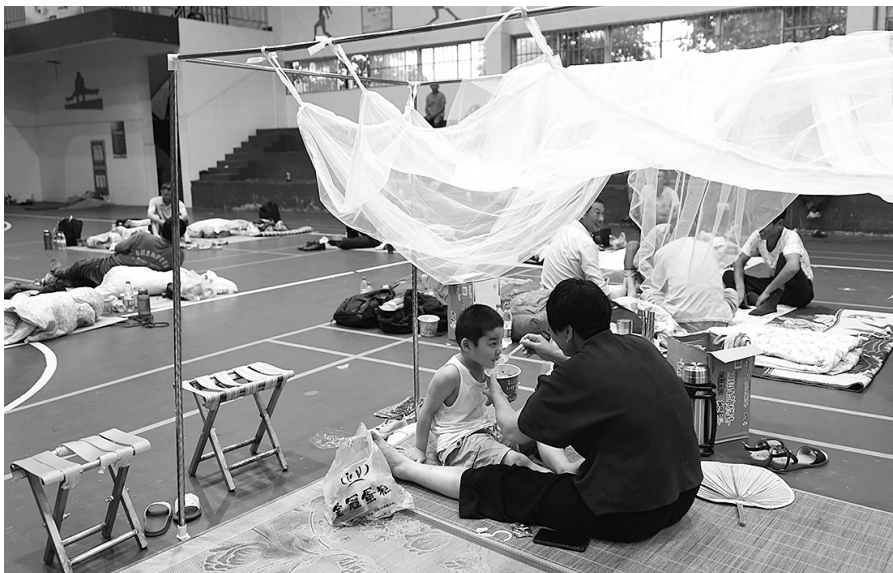
7月24日,在象山县实验小学安置点,一名家长在给孩子喂泡面。安置点给群众免费提供泡面、饼干、瓶装水等生活物资。

浙江省防指已于24日12时将防台风应急响应提升至Ⅰ级。截至台风“烟花”登陆前,浙江全省1.7万艘海洋渔船已全部在港避风,共开