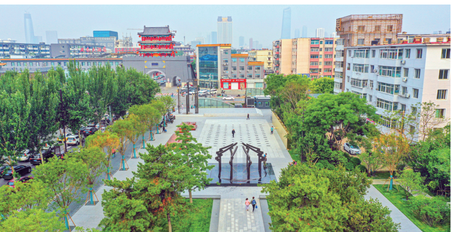
沈阳市大东区会客之仪口袋公园。

在口袋公园的建设选址方面,大东区进行了实地调查、筛选,主要选择三类点位。居住密集区,让市民能够抬头见绿、出门入园;现有小