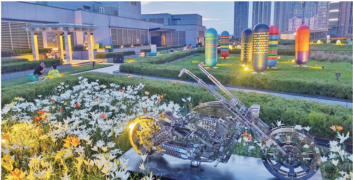
位于K11楼顶的雕塑公园,显示出宁谧之美。