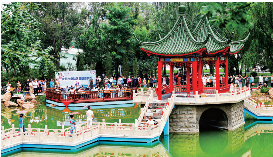
百鸟公园向人们展示不似江南胜似江南的园林美景。