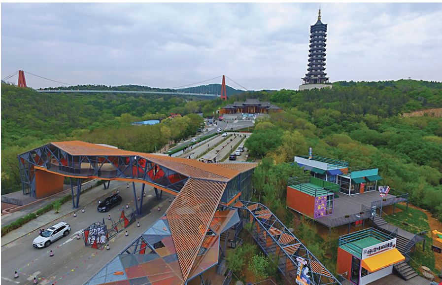
怪坡自从面世以来，一直很神秘。