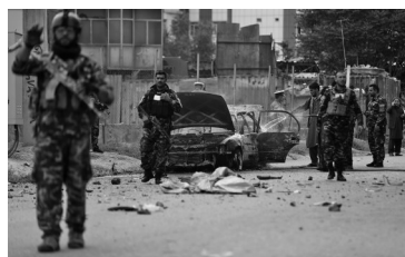
7月20日,安全人员查看阿富汗喀布尔的袭击现场。

阿富汗内政部发言人米尔瓦伊·斯塔尼克扎伊20日对媒体说,当天上午8时许,袭击者从位于喀布尔第四警区的一辆汽车上发射了3枚火箭弹,火箭弹在总统府附近爆炸。