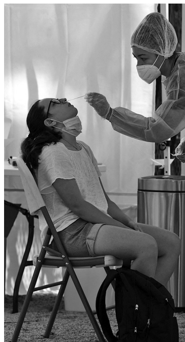
7月21日,在法国巴黎埃菲尔铁塔附近一处新冠检测点,医务人员为游客进行新冠检测取样。

法国卫生部长韦朗20日表示,变异新冠病毒德尔塔毒株正在法国快速传播,该国过去24小时新增确诊病例超过1.8万例,增长速度前所未有。