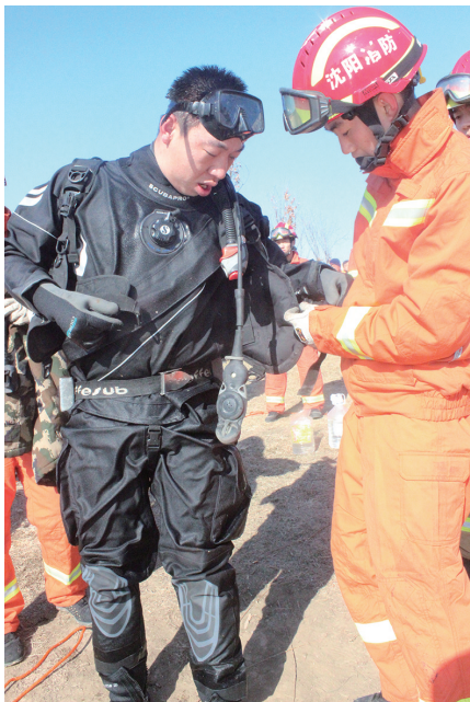
范伟准备下潜救援。