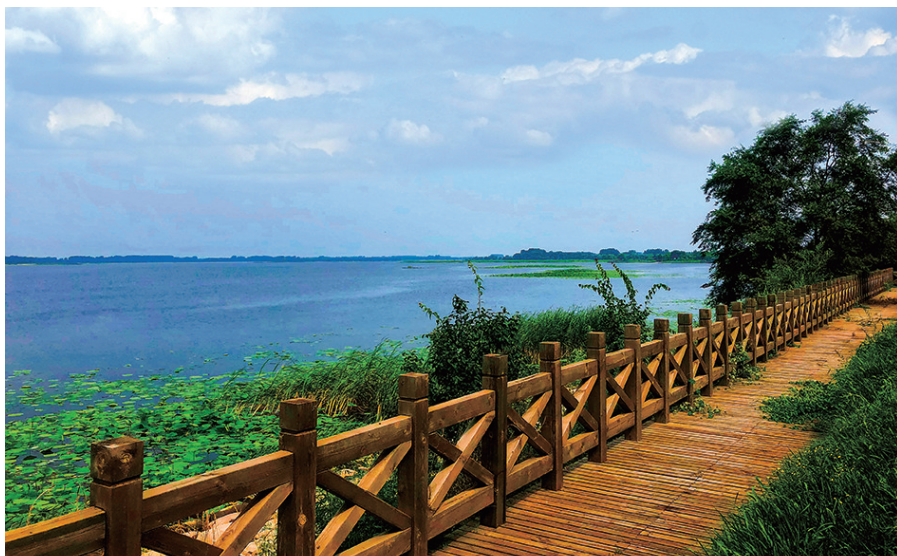
辽中蒲河国家湿地公园，被誉为放空心情的“沈西后花园”。