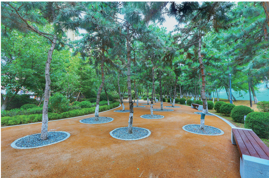
河畔西街口袋公园。

富民西街口袋公园占地0.62公顷。场地原为富民街西侧封闭式防护绿地，功能单一，绿地内有穿越绿地通勤以及休闲需求。于是浑南区以打造“林荫下的健跑道”为目标，利用原有高大杨树林，在密林间设置250米健跑道，设置健跑标识，打造“森呼吸”式健跑空间；同时沿途布