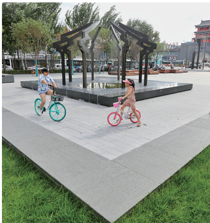
“会客之仪”口袋公园一角。