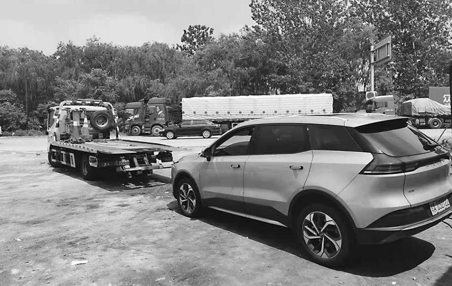
邴先生租的车坏在高速公路上被拖走。