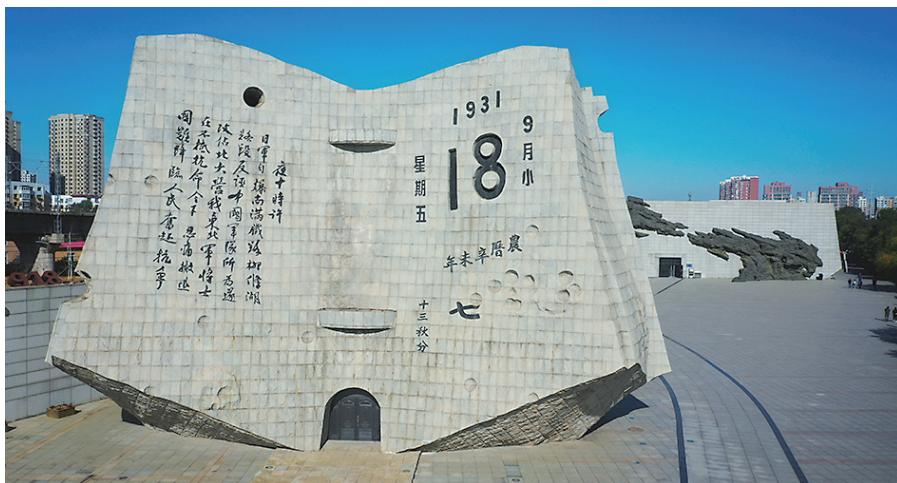
“九·一八”历史博物馆残历碑。