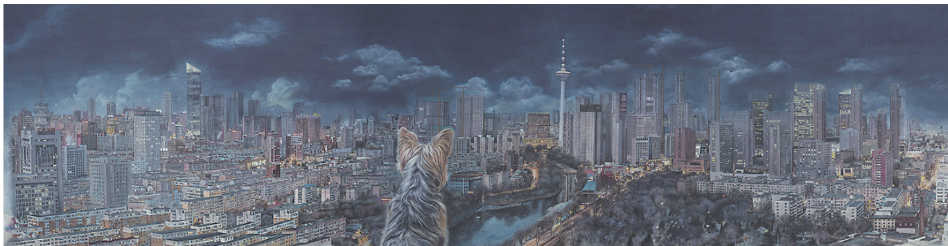
巨幅写实国画《沈阳》。