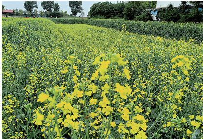
沈阳三农博览园目前正是赏油菜花的季节。

春末夏初时节，与草长莺飞一同繁茂的，还有恣意绽放的百亩油菜花，徜徉其中，花香四溢，美不胜收。在新民市区北新柳公路13公里处，就有一处网红打卡胜地，位于沈阳三农博览园内。每年这里都要举办“赏花节”，六、七月份赏油菜花、向日葵花、荷花，九、十月份赏荞麦花、向日葵花。刚刚过去的6月，正值油菜花盛放，放眼望去，阡陌纵横，千簇繁花。来这里，你甚至不需