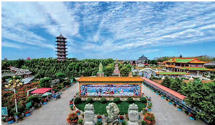
沈阳三农博览园有三十多个不同类别的展馆，十余处景观。

春末夏初时节，与草长莺飞一同繁茂的，还有恣意绽放的百亩油菜花，徜徉其中，花香四溢，美不胜收。在新民市区北新柳公路13公里处，就有一处网红打卡胜地，位于沈阳三农博览园内。每年这里都要举办“赏花节”，六、七月份赏油菜花、向日葵花、荷花，九、十月份赏荞麦花、向日葵花。刚刚过去的6月，正值油菜花盛放，放眼望去，阡陌纵横，千簇繁花。来这里，你甚至不需