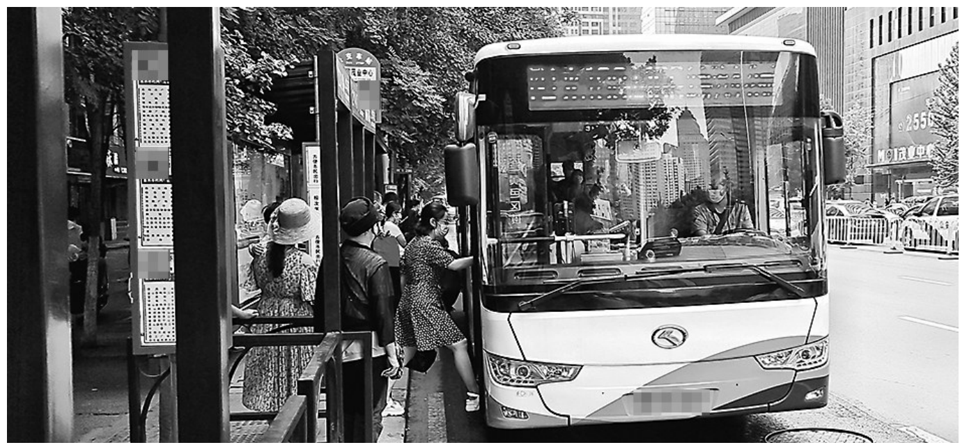
沈阳新增或更新的公交车将全部采用新能源汽车。

对当年固定资产投资额达500万元以上的新能源汽车整车及关键核心零部件技术改造项目、新能源及智能网联汽车关键零部件新建项