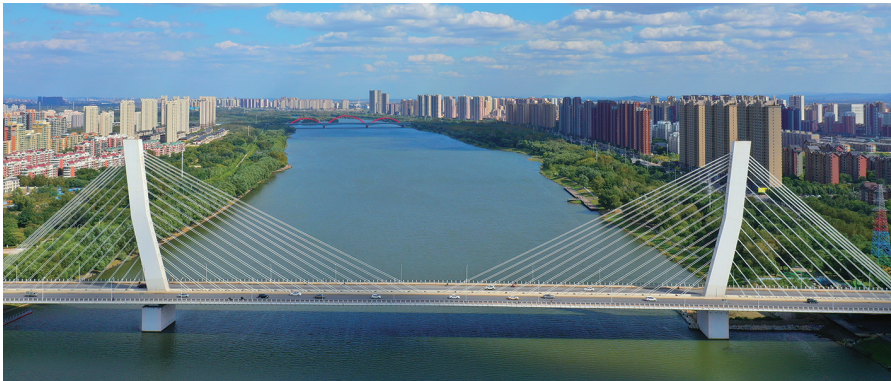
富民桥主桥结构形式为折线形双塔斜拉桥。