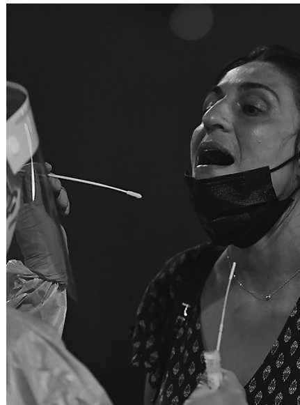
7月5日,医务人员在西班牙潘普洛纳为一名年轻人进行核酸检测。