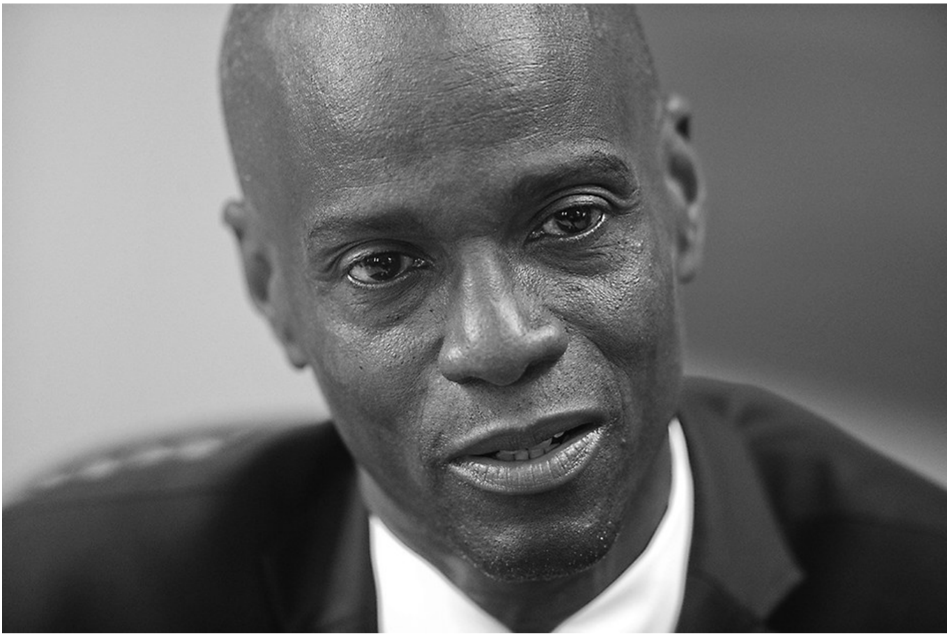
据当地媒体报道,海地总理约瑟夫7日说,海地总统莫伊兹遇刺身亡。这是2020年2月7日海地总统莫伊兹在首都太子港郊区的家中接受采访的资料照片。