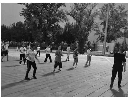
广场灯亮了,市民们又舞起来了。

6月1日,“辽沈帮帮帮”以《广场舞大妈盼灯亮起来》为题报道沈河区东塔桥北广场没有照明愁坏广场舞大妈的事。