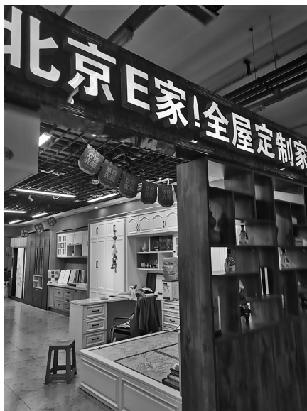
“北京E家”未按约定日期安装橱柜,没有兑现承诺。