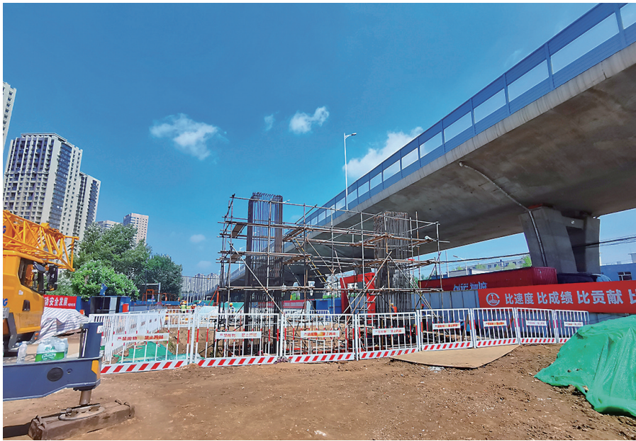
在二环与沈吉铁路交叉口,高官台街公铁立交桥施工现场,目前正在进行桩基施工。

根据现场的项目效果图可以看出,公铁立交桥是在现有二环桥两侧各修建一座高架,把之前地面道路与铁路平交的现状,改为立交。这样,不但可以让想跨铁路而过的车流快速通