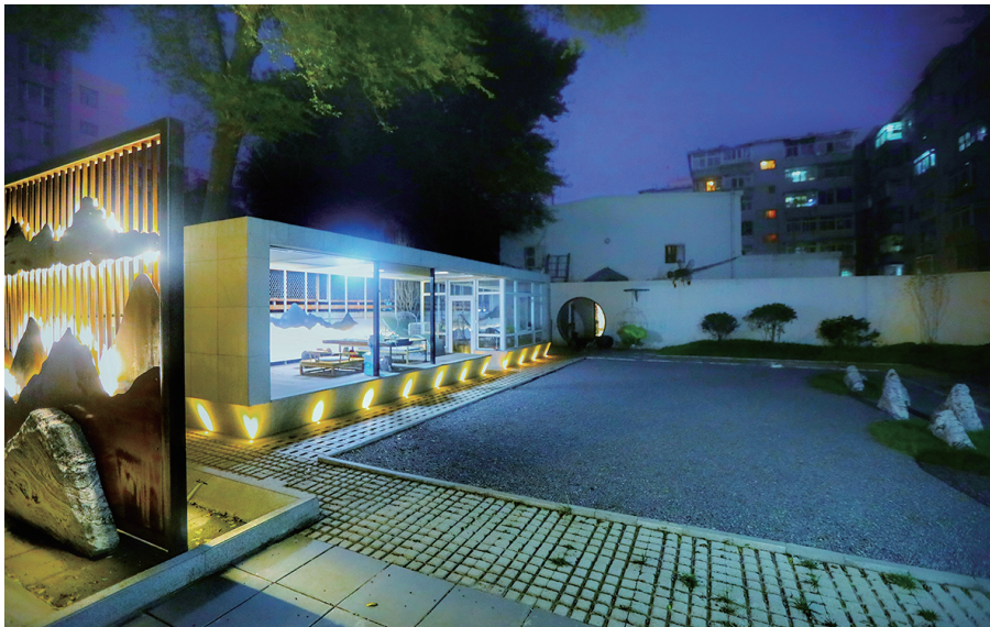
让人很难想象的是，知舍艺术空间曾是一个燃煤锅炉房。

这里是知舍艺术空间，占地面积1050平方米。有别于一般美术馆的单一性，它是集特色店