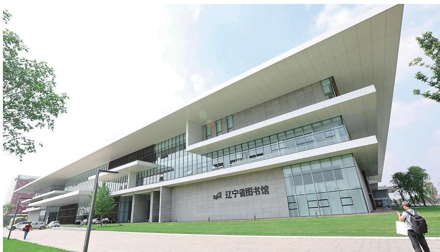
辽宁省图书馆外景。