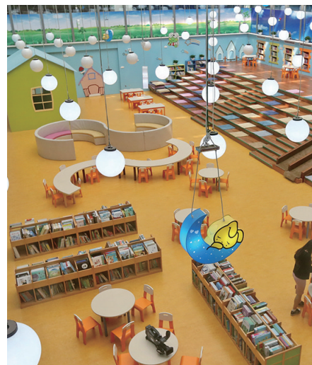
辽图少儿阅览区提供舒适阅读空间。

海量的书籍、珍贵的古籍、丰富高质量的阅读推广活动。辽宁省图书馆一直在用书籍、知识装点并照亮着我们的生活，让阅读走进我们的生活，让我们去体验阅读的快乐。