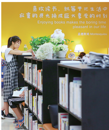
辽图24小时自助图书馆。