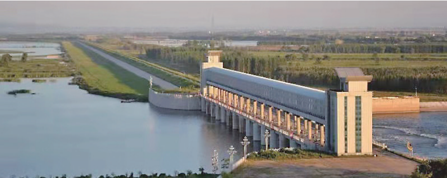
七星湖景区依托全国最大的平原湿地型水库——辽宁省石佛寺水库而建。

水、绿树、鲜花交相辉映，宛如人间仙境。蔚蓝的天空下，花红草绿，柳舞蛙鸣，鸟飞鱼戏，质朴而美好的水域风光像一块璞玉，抚平你烦躁的心绪，是喧嚣城市中难得的休闲胜地…… 在莲花盛开季节，在芙蓉或溪亭码头出发，乘着木船便进入了“接天莲叶无穷碧，映日荷花