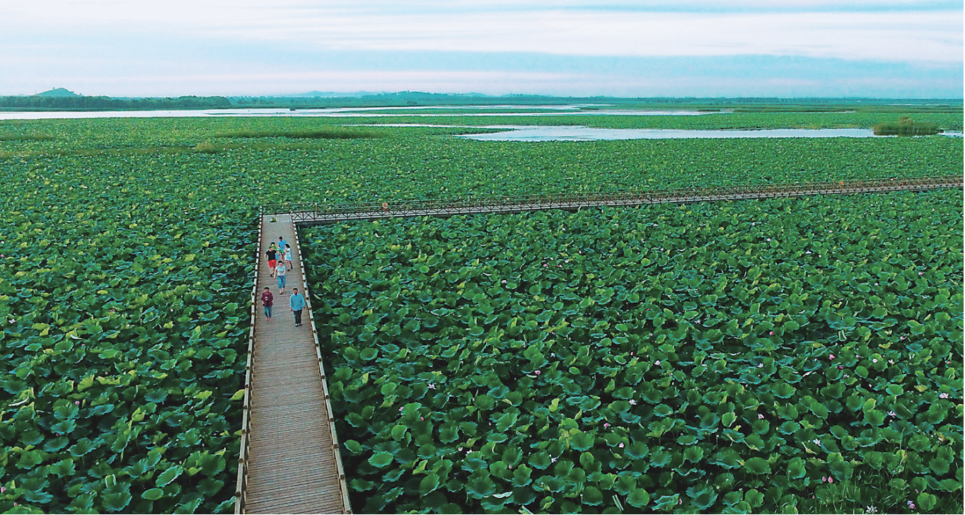
游客观荷、赏荷，欣赏水天一色的优美风光，感受远离城市喧嚣的生态之美。

说起辽河，大家都很熟悉，它宛如一条巨龙横卧在东北大地上，作为大自然鬼斧神工的杰作，它是艺术家作品中充满诗情画意的宠儿，柔曼的水流如婉约的小诗，奔腾的激流似雄浑的交响乐。 辽河七星湖景区位于沈阳市沈北新区黄家乡和法库县依牛堡乡之间，景区依托全国最大的平原湿地型水库——辽宁省石佛寺水库而建，属辽河国家湿地公园的核心区域。石佛寺水库水利风景区以辽宁人民的母亲河——辽河为依托，显现了其无穷的魅力；放眼眺望，石佛寺水库一望无际的碧波绿意，使心伴着微风的和煦轻轻的摇曳。 按照相关要求，石佛寺水库实施了生态工程建设，其中包括主副坝林台建设、库区平整、人工岛修建、野生柳树保护、水生植物栽植等项目。 这项工程的实施有效地改善了水库周边气候及辽河中下游地区生态环境，初步形成了别具特色的水库生态体系。同时，通过地表水与地下水的联合调度，水库还承担着沈阳市沈北新区近十万人的生产和生活供水任务，为地方经济的快速发展提供了重要的水资源保障。 七星湖景区内河水浩淼，水天一色，各种植物枝繁叶茂，生机无限。栽植有树木19.28万株、芦苇2600亩、蒲草5500亩、荷花3000亩、苕菜800亩。 广袤的湿地成为鸟鱼的天堂，常见有野鸭、雉鸡、丹顶鹤、白鹤、大雁、白鹭、灰鹭等20余种，辽河野生草鱼、鳊鱼、鲫鱼、鲤鱼、鲢鱼、鲮鱼等10余种。 无垠的湖面上人工岛屿众多，与蓝天、碧