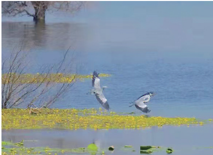
辽河七星湖景区是鸟鱼的天堂。

市；沈阳，一座现代感触手可及的城市。它，规矩又不失浪漫，古老又接纳创新，一座遇到就会让人忍不住喜欢上的城市，一个即使离开也会为它魂牵梦绕的地方。 即日起，在本报年度大型主题策划《发现最美沈阳》的分项单元里，我们设计了“自然景观 美轮美奂”主题，本报诚挚邀请您通过各种形式参与你心目中的自然美景推介活动。通过你的推介，让人们熟知这些自然美景；通过你的分享，让人们发现最美沈阳。让最美风光点缀你我的生活，让更多的人爱上沈阳。