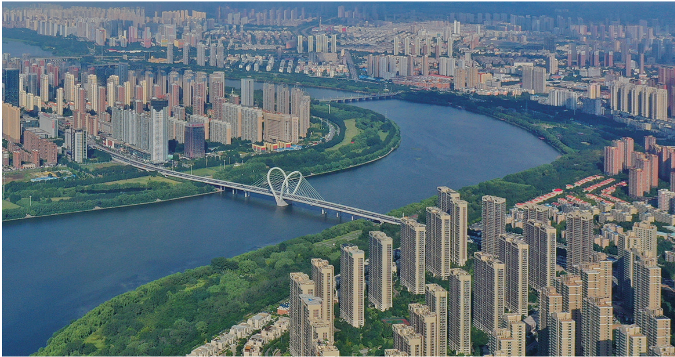
三好桥如一条纽带连接着旧城区与长白岛。