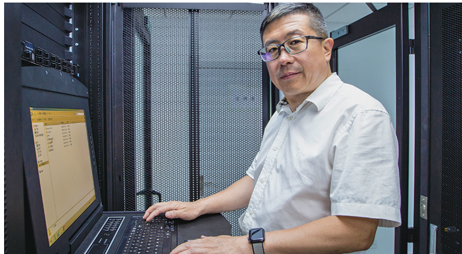
单洸在沈阳创业多年,现在专注于网络安全等领域。