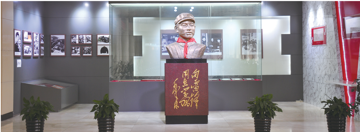
工行抚顺雷锋支行。

目前全省555家营业网点已经实现标准设施配置,围绕共享便民、公益为民、宣教亲民、扶贫惠民、融合利民等领域达成志愿服务1592项。在多维联动、立体协同的架构中,辽宁工行不仅是积极履行社会责任的国有银行,更在全面推进“工行驿站”的内涵深化与品牌打造中,努力争做有温度、有感情公益惠民服务中心。