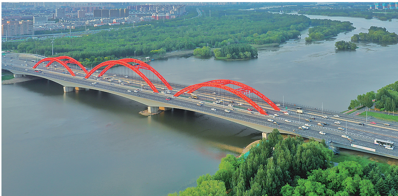
横跨浑河的长青桥宛如长虹卧波。

位置： 沈阳市区东南部，长青街南端跨越浑河 桥梁全长： 约629米 建成与改造时间： 长青桥老桥于1997年7月1日竣工通车；2018年，沈阳市建设长青街快速路，对该桥扩容改造，由双向4车道扩容至双向10车道