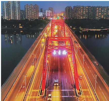
长青桥已经悬挂手写体桥名。

一座座新建的跨浑河桥，让沈城南部的城市发展有了更为广阔的空间，让城南居民的生活得以畅快的延伸。然而，随着时代的发展，曾经发挥过巨大作用的老桥，也亟待焕发新的活力。长青桥正是如此，服役24年间，历经大修、扩宽，从旧到新，从有到优。