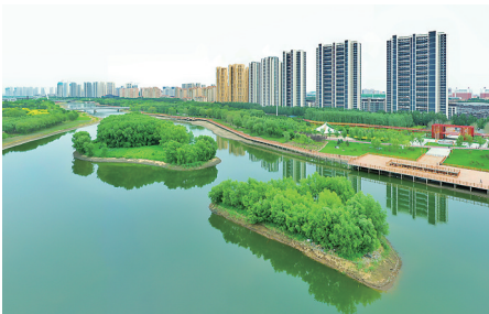
蒲河水碧岸青，小岛点缀其间。

从即日起，哪些是沈阳最具有代表性、人气旺盛的特色美景、美宿、美食、美店……美景包含各大景区景点、乡村旅游点和古村民居，美食包含各种美食餐厅、各类风味小吃和特色餐饮店，美宿包含民宿和酒店，美店包括文创产品和土特产品等购物点。沈阳各区有颜值、有气质、有文化、有内涵、有个性、有特点的“打卡地”均可作为推荐对象。