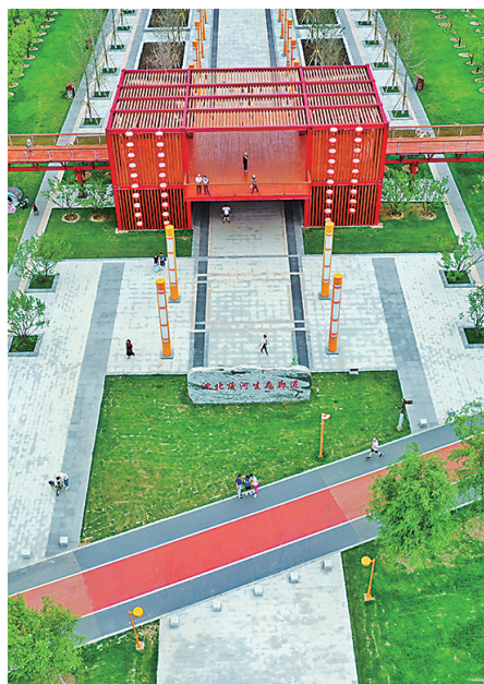
栈道、慢行道交错在蒲河岸边，行走其间，移步换景。