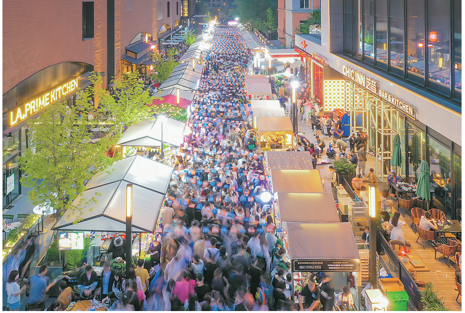
周末的歇马夜市，人流交织。