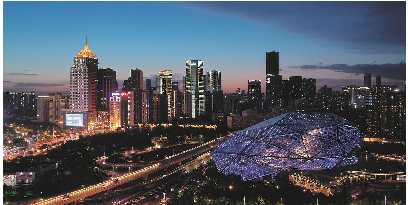
发现最美沈阳——鸟瞰夜沈阳。