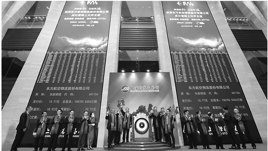
东航物流上市敲钟。

6月9日,作为国家首批、民航首家混改试点企业,东航物流正式发行上市。Wind数据显示,昨日开盘,东航物流股价高开,最高涨幅超44%。 招股书显示,东航物流拟公开发行股票不超过15875.56万股,预计募集资金使用额240585.77万元,拟将募集资金投资于浦东综合航空物流中心建设项目、全网货站升级改造项、备用发动机购置项目和信息化升级及研发平台建设项目。 作为国家首批、民航首家混改试点企业,东航物流创新驱动、转型发展,被称为民航混改“第一样本”。 招股书显示,东航物流是一家现代综合物流服务企业,业务涵盖航空速运、货站操作、多式联运、特种仓储、跨境电商、供应链服务、航空特货解决方案和产地直达等领域。 本版内容及观点仅供参考,不构成对所述证券的投资建议,投资者不应以本文作为投资决策的唯一标准,市场有风险,投资需谨慎。