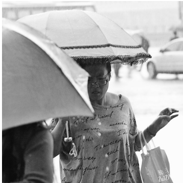
辽宁将再次出现区域性大雨到暴雨、局部大暴雨。

受东北冷涡影响，预计昨天夜间至今天，辽宁将再次出现区域性大雨到暴雨、局部大暴雨。中部及东南部分地区降雨量可达40~70毫米、局部80~120毫米；其他地区降雨量为20~40毫米、局部50~80毫米，上述地区并伴有雷电、短时强降水、大风、冰雹等强对流天气。