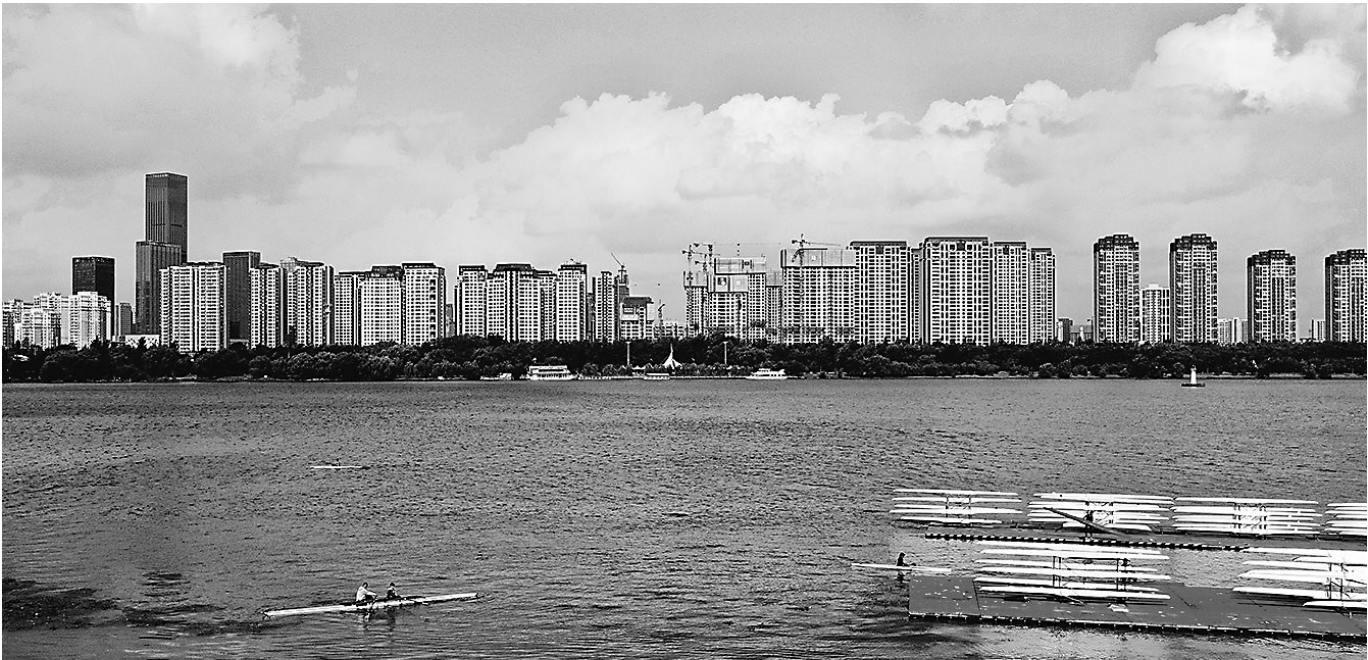
沈水湾一带是沈城人必去打卡纳凉的好地方。

沈阳都市旅游圈各市、区的文旅活动特色各异,丰富多彩,多品味、多需求的旅游“大餐”