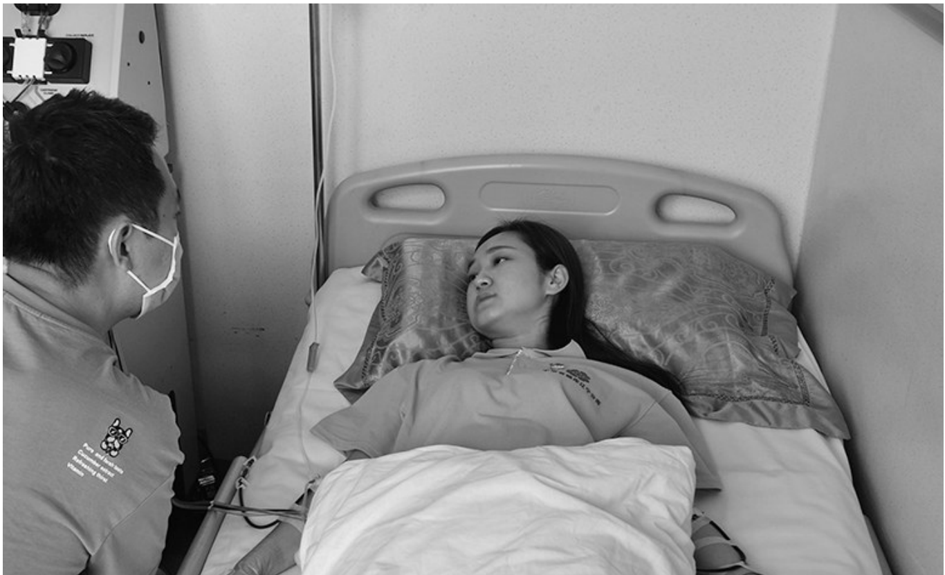
小那说：“希望能有更多人加入中华骨髓库，给血液病患者送去生的希望。”