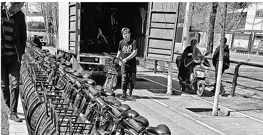
沈阳开展万人骑行共享单车消费体察活动,收到反馈停车有效问题356件。

此次活动由共享单车企业免费提供5日单车骑行卡,由沈阳市内五区及浑南、于洪、沈北区的消费维权志愿者及消费者广泛参与体验,并及时反馈发现问题。据统计,共有近30余万人次参与了此次骑行消费体察活动,收到反馈共享单车停车有效问题356件,问题集中在地面无停车框需要增设、地面有停车框却无法停车两大方面。其中无停车框需增设的投诉占比32%,有停车框却无法还车投诉占比68%,是消费者相对关注、反映比较集中的