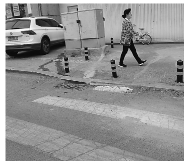
裸露地面的线缆已处理。

5月27日，“辽沈帮帮帮”以《线缆在人行道走明管 很容易将行人绊倒》为题，报道了万寿寺街北清真路交叉口线缆连接混乱，从通讯井中引出的线缆穿在胶管当中直接铺在盲道和人行道上，最后进入到电柜当中。