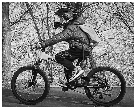
小朋友丢失的爱车。