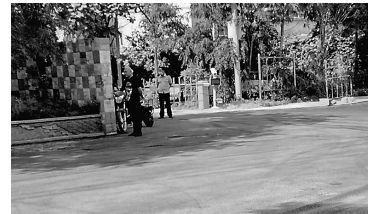
坑洼路面已经修复。

5月24日，辽沈帮帮帮以《小区门口坑洼不平 下雨天积水难行》报道铁西区三号街十四号路友谊城小区西南门路面坑洼不平，每逢下雨便积水难行的情况。