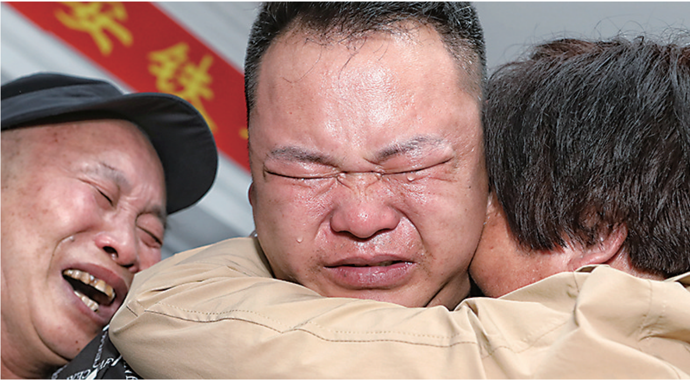
小杰在沈阳与亲生父母团聚,三个人紧紧抱在一起,泪如雨下。

对于7岁的小杰来说,那是人生中最恐怖的经历,直至现今还经常做噩梦。 26年前的那个上午,小杰正在和小伙伴一起玩耍,妈妈就在不远处卖水果。平日里小杰都是在妈妈视线范围内的地方玩,而这一次他