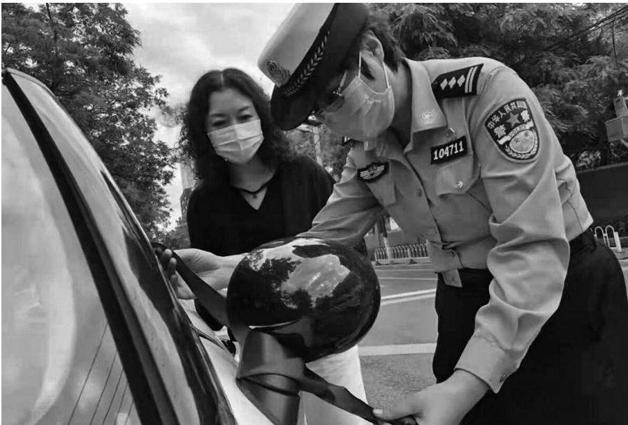
见到系蓝丝带的送考车请让行。

一年一度的高考即将来临！同学们都准备好了吗？下面这些事儿，不管你家里有没有考生都要看看。 今年高考，沈阳市共设置55个考点，1000余个考场，共有3万余名考生参加考试。 为做好全市高考交通安保工作，为广大考生创造畅通有序的出行环境，沈阳公安交警开展“蓝丝带”护考行动，保证高考工作安全顺利进行。 考试期间，“蓝丝带”将作为送考车辆统一标记物，考生家长要提前将蓝丝带以“蝴蝶结”状系在车辆左、右两侧后视镜上。公安交警将以确保安全、畅通为前提，根据实际情况为“蓝丝带”送考车辆开辟“绿色通道”，给予优先照顾放行。同时，引导社会车辆主动对“蓝丝带”车辆予以让行。 对于送考车辆驾驶员的轻微交通违法行为，执勤交警原则上采取教育警告方式进行处