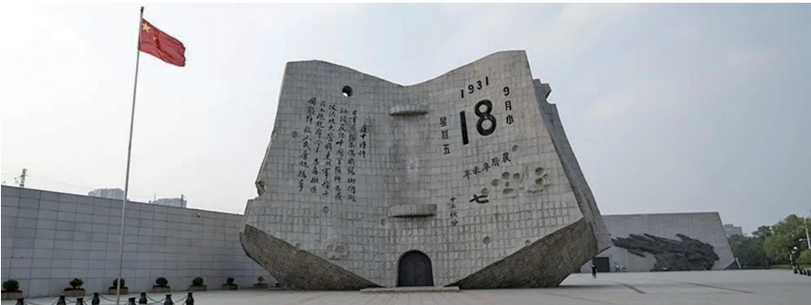
“九·一八”历史博物馆。

这条线路由沈阳市秀水河子战役纪念馆出发,至锦州市黑山阻击战纪念馆结束,依托辽宁战争遗址资源,以锦州市辽沈战役纪念馆、葫芦岛市塔山阻击战纪念馆为核心,展现我党我军