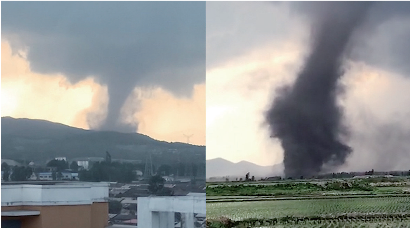
6月1日，哈尔滨尚志市遭受龙卷风和冰雹强对流天气。