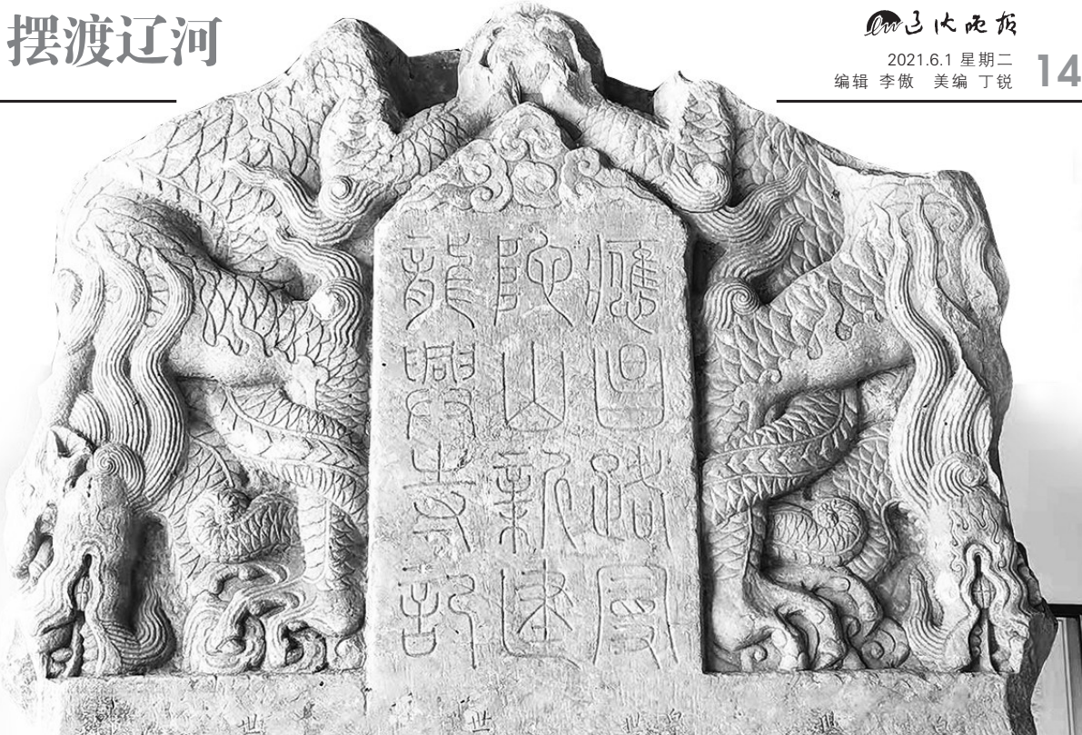
元代应昌城存碑碑首篆书：应昌路曼陀山新建龙兴寺记

上世纪九十年代中期，风风火火经营了十七八年的九路市场，才“退路进厅”，结束了自己特定的历史使命，功成身退。