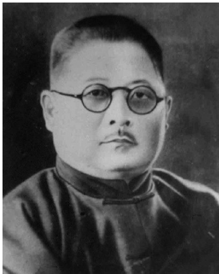
抗日英烈吉鸿昌(资料图)

吉鸿昌,1895年生,河南扶沟人。1934年5月,吉鸿昌参与组织了“中国人民反法西斯大同盟”。11月24日,吉鸿昌英勇就义,年仅39岁。