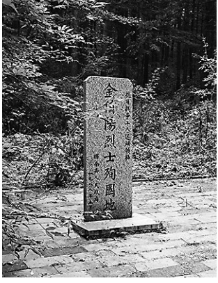
吉林辉南的金伯阳殉国地纪念碑。