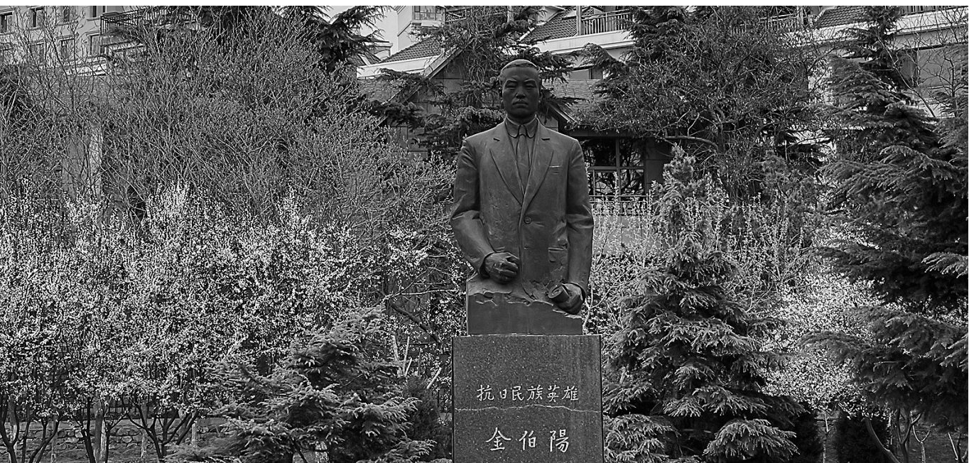
旅顺伯阳公园的金伯阳纪念雕塑。