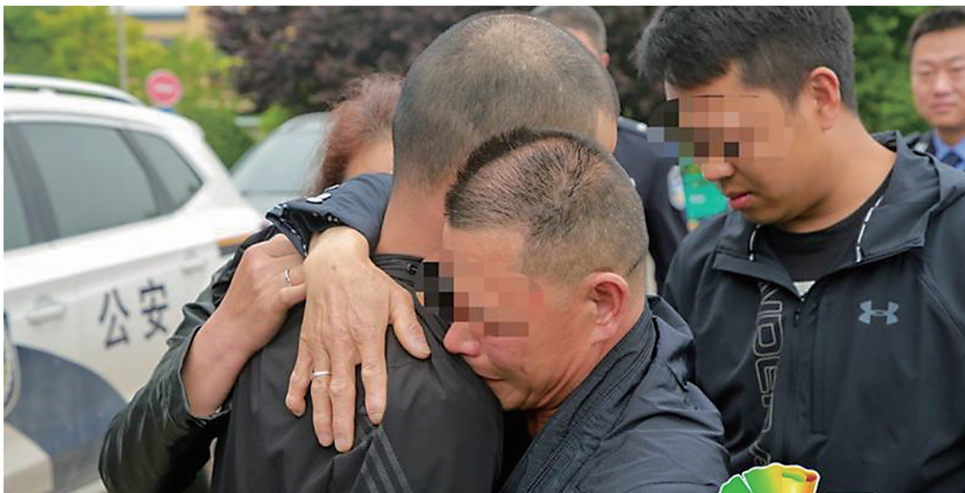
柳某某、李某某夫妇终于与失散28年的儿子相聚。