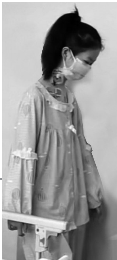
源源已能下地走了。

“换心”获救的14岁女孩说：把我给救活了，可惜那个小朋友却不在，我代替着他看这个世界吧。