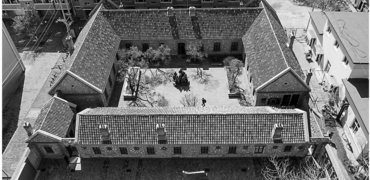
中共沟帮子铁路支部旧址。

从沟帮子火车站向东几百米,能看到一个古朴的院子,那就是辽宁最早的党支部——中共沟帮子铁路支部所在地。 1924年,北镇沟帮子成立辽宁最早的中共党支部中共沟帮子铁路支部,隶属于中共唐山地委,欧阳强任该支部第一任书记。1927年,中共沟帮子铁路支部转归满洲省委领导。1930年,时任中共满洲省委书记的刘少奇带领中共满洲省委、奉天特委部分领导亲自到沟帮子铁路支部视察并指导工作。在刘少奇的领导下,以沟帮子为中心,北宁铁路关外段爆发了一次大规模的罢工斗争,最终取得了重大胜利。 2015年8月,北镇市启动中共沟帮子铁路党支部活动旧址修缮工程。作为东北地区重要的革命遗址类博物馆,中共沟帮子铁路支部旧址纪念馆成为加强党员干部教育和开展爱国主义教育的重要场所。