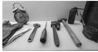
欧阳强用过的工具。