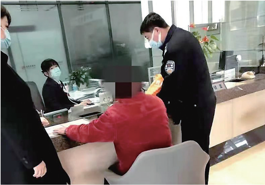
银行员工和民警联合阻止老太给骗子转账。

对于“民警”的电话,老人深信不疑,当即就告诉对方自己有3家银行的银行卡,共有人民币38600元。对方又让她把葫芦岛另外两张银行卡内的现金转入中国农业银行的银行卡内,再按他提供的账号把钱转过去,好替她把钱保管起来,以避免“进一步损失”。万幸,正在办理的过程中,被银行工作人员和双龙派出所民警及时制止。