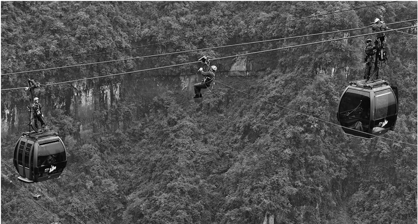
湖南张家界天门山举行索道应急救援联合演习。

对于经努力到规定就寝时间仍未完成作业的学生,应按时就寝不熬夜,教师要利用课后时间有针对性帮助学生分析原因,加强学业辅导,提出改进措施。 各级教育督导部门要加强督导检查力度,要把学生睡眠管理工作纳入日常监督范围和政府履行教育职责督导评价,对中小学生学习睡眠质量、时长等方面进行充分评估,着力督促各地各校保证睡眠管理工作落实到位,取得实效。各地要设立监督举报电话(省监督举报电话:024-86891848,举报邮箱:lnsjygf@163.com),对群众反映强烈的中小学生学习睡眠管理问题及时回应,认真查实,严肃处理。 辽沈晚报首席记者 经森