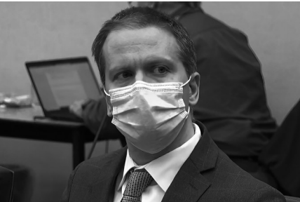
这张视频截图显示,4月20日,美国前白人警察德雷克·肖万在明尼苏达州明尼阿波利斯市听法官宣判。

系服用阿片类药物、有潜在心脏病、受警车尾气影响等多种因素造成。但检方对此一一反驳,力证弗洛伊德死于肖万“跪颈”造成的缺氧窒息。 19日结案陈词时,法庭上再度播放弗洛伊德死亡视频,检方呼吁陪审员“使用常识……相信自己的眼睛”。根据美国的陪审团制度,所有陪审员须意见一致,只要一人反对便无法定罪。此案12名陪审员包括6名白人、4名黑人,另外两人有多族裔血统。这些人均非法律专家,他们仅审议约10小时就对三项指控分别达成一致,速度之快超过美媒预期。 据美媒报道,肖万可能寻求上诉。但此间分析人士认为,肖万上诉获胜的可能性很小。 历年来,在美国警察针对非洲裔暴力执法案件中,涉案警察大都安然无事。弗洛伊德案宣判前,美国朝野普遍担心,如果对肖万判决较轻会引发抗议和骚乱。多地气氛紧张,首都华盛顿等城市调集国民警卫队加强安保。明尼阿波利斯所在县和相邻地区19日起进入紧急状态,当地许多商户和机构用木板封住门窗。 判决宣布后,聚集在法庭外和弗洛伊德遇害地点的人群一片欢呼。在美国各地,许多人如释重负。美国副总统哈里斯说,判决结果没有消除美国长期存在的系统性种族主义所带来的痛苦,但让美国人“松了一口气”。 但哥伦布市当天响起的警察枪杀非洲裔女孩的枪声和当晚发生的抗议活动表明,美国人“松口气”的时间是多么短暂,而系统性种族主义带来的痛楚是多么难以根除。 事实上,美国人究竟能否“松口气”,都应该打上问号。在弗洛伊德之死引发全美大规模抗议浪潮后,美国各地仍不断发生警察暴力致死少数族裔事件,仅近期就出现多起: 3月29日,在芝加哥,一名警察开枪射杀13岁拉美裔少年亚当·托莱多。 4月初,在得克萨斯州,7名警察因涉嫌致使一名非洲裔在押人员死亡而被解职。 4月11日,在明尼苏达州布鲁克林森特市,一名白人女警误把手枪当电击枪,打死20岁非洲裔青年当特·赖特…… 正如美国全国有色人种促进会在弗洛伊德案宣判后发表的声明所说,美国“争取问责警察和尊重黑人生命的斗争远未结束”。