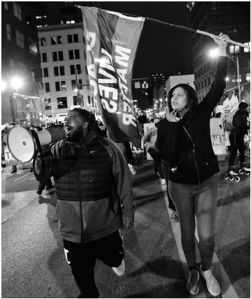
4月20日,人们在美国俄亥俄州哥伦布市游行抗议。综合美国媒体报道,美国俄亥俄州首府哥伦布市一名非洲裔女孩20日遭警察枪击身亡。

美国俄亥俄州哥伦布市20日晚出现民众抗议,起因是一名16岁非洲裔女孩当天早些时候遭警察枪击身亡。 这名女孩的亲戚告诉当地媒体《哥伦布电讯报》,女孩住在一个寄养家庭,与另一名家庭成员争吵打架。有人报警后,警察赶到,开枪击中女孩。她后来被送到医院,不治身亡。 哥伦布市警察局当天晚些时候公布了涉事警察随身佩戴的执法记录仪所拍摄到的现场画面。画面显示,一名黑人女孩持刀冲向另一名女孩,警察这时开枪,持刀女孩中弹后瘫倒在地。