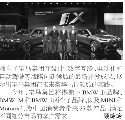
融合了宝马集团在设计、数字互联、电动化和自动驾驶等战略创新领域的最新开发成果,展示出宝马集团在未来豪华出行领域的实践。今年,宝马集团将携旗下BMW主品牌、BMW M和BMW i两个子品牌、以及MINI和Motorrad,为中国消费者带来25款产品,满足不同细分市场的客户需求。顾玲玲

在2021上海车展上,宝马集团携旗下各品牌,展示出集团向数字化、电动化、可持续未来出行迈进的坚定姿态。创新BMW iX和全新BMW iDrive等划时代产品的亮相,诠释了宝马集团对于新时代语境下“以客户为中心”的全新定义。其中,全新BMW iDrive为全球首发。BMW iDrive诞生20年,历经7代迭代,引领智能人机交互潮流。全新BMW iDrive是更加简便易用、更安全的车载显示和操作系统,配以BMW操作系统8.0、一体式悬浮曲面屏、经过重新设计的控制面板和用户界面,以及强大的互联和数据处理能力,将驾驶者与车辆之间的互动带入日益智能的数字化未来。作为宝马集团创新和科技旗舰,BMW i品牌最新产品——创新BMW iX为亚洲首发,它