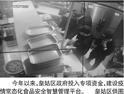
今年以来,皇姑区政府投入专项资金,建设疫情常态化食品安全智慧管理平台。

通过安装摄像头和智慧化监管平台的搭建,沈阳市皇姑区市场监督管理局对餐饮单位后厨、餐饮环节冷库等实现了视频检查、监管,发现轻微违规行为,通过麦克风喊话进行现场提醒纠正。下一步,这一智慧监管领域将扩大至中小学食堂、餐饮单位、药房和加油(气)站等领域。“你现在厨房里边存在人员没戴工帽、口罩的行为,墙壁上还有苍蝇在飞,马上改正,抓紧落实。”在皇姑区市场监管局疫情常态化防控食品安全监管指挥中心,该局餐饮科