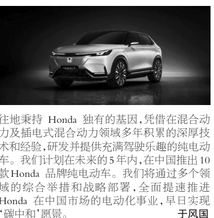
往地秉持Honda独有的基因,凭借在混合动力及插电式混合动力领域多年积累的深厚技术和经验,研发并提供充满驾驶乐趣的纯电动车。我们计划在未来的5年内,在中国推出10款Honda品牌纯电动车。我们将通过多个领域的综合举措和战略部署,全面提速推进Honda在中国市场的电动化事业,早日实现‘碳中和’愿景。于风国

本届上海车展,中国首款Honda品牌纯电动原型车Honda SUV e:prototype正式迎来全球首发,基于该款原型车打造的量产车将于2022年春季上市。此外,插电式混合动力车型皓影(BREEZE)锐混动e+也献上了全球首秀,将于今年下半年上市。伴随多款电动化战略车型的发布,Honda中国进一步扩大混合动力、插电式混合动力到纯电动车的电动化产品阵容,展现了Honda独有的电动化技术的综合实力。Honda常务执行董事兼中国本部长井上胜史表示:“自诞生以来,Honda便以追求出色的环保性能与极致的驾控乐趣为目标,很早开始投身汽车电动化技术的研发和积累,不断推动电动化技术的升级。我们希望能够一如既