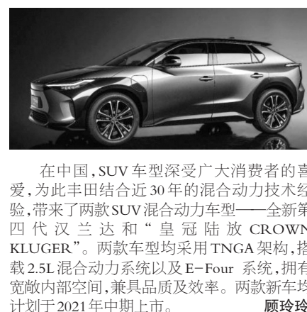
在中国,SUV车型深受广大消费者的喜爱,为此丰田结合近30年的混合动力技术经验,带来了两款SUV混合动力车型——全新第四代汉兰达和“皇冠陆放CROWN KLUGER”。两款车型均采用TNGA架构,搭载2.5L混合动力系统以及E-Four系统,拥有宽敞内部空间,兼具品质及效率。两款新车均计划于2021年中期上市。顾玲玲

4月19日,上海车展,丰田面向全球首次揭幕了旗下全新纯电动专属系列“TOYOTA bZ”,展出了该系列的首款概念车“TOYOTA bZ4X CONCEPT”。除此之外,丰田还发布了全新第四代汉兰达以及“皇冠陆放CROWN KLUGER”两款SUV混动车型。并且深受消费者喜爱的丰田全方位电动化车型,以及“GA-ZOO Racing”品牌车型等也一同展出。本次发布的TOYOTA bZ纯电动专属系列,以EV专用平台为基础,能够应对不同大小、形状等车辆多样化需求。其首款概念车TOYOTA bZ4X CONCEPT计划在中国和日本进行生产,预计2022年中旬前全球销售。作为全方位电动化的一环,到2025年时,丰田将在全球范围内推出15款EV车型,其中TOYOTA bZ纯电动系列,计划推出7款。