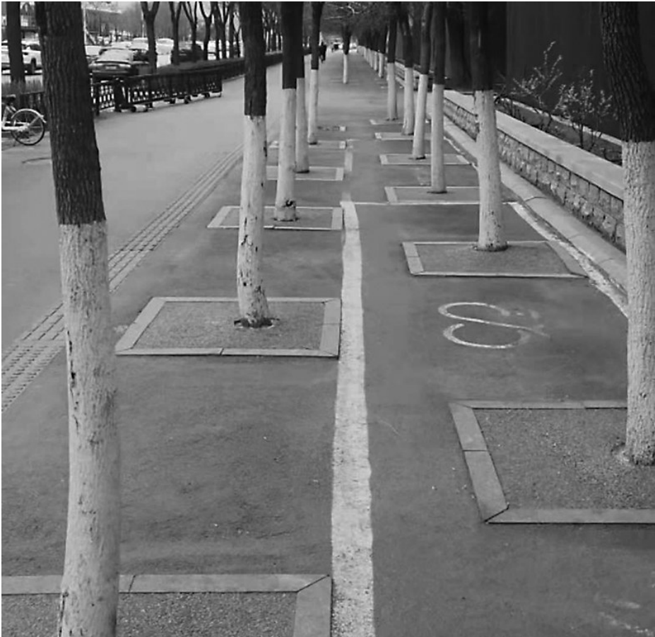
青年大街人行道上的大树根部被水泥和石子覆盖。