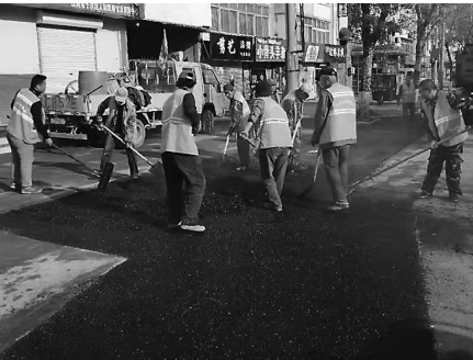
川江街修整工程本周六前全部结束。

该局工作人员介绍，因为今年冬季施工的限制，当初的应急维护后一直因为温度条件的原因未正式进行施工。根据气温和土层情况，川江街的施工从4月11日开始，总长986米的施工长度现在已经完成590米，沥青1450平方米。目前施工已经完成一半多，剩下的400米长度的施工将在规定的时间内完工。