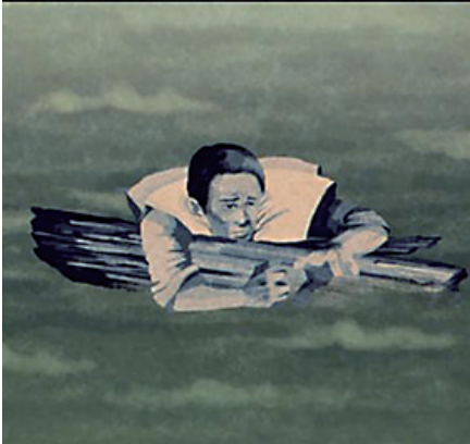
中国幸存者中有一位抓住了一块门板。